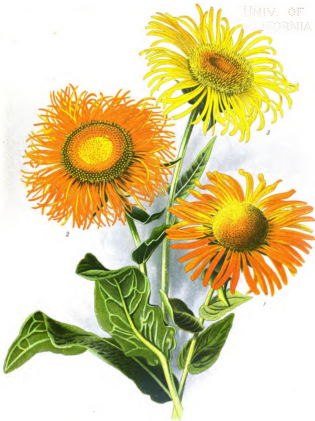
Inula glandulosa (1); var. laciniata (2); et I. macrocephala (3).

Девясиль желтцвѣтн [1.]; разность его съ разсѣченными листьями [2.] Digitized by Google Девясиль крупноцвѣтн [3.] UNIVERSITY OF CALIFORNIA